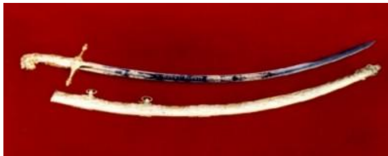
Foto de um Espadim de Caxias dos Cadetes do Exército

No dia 22 de agosto, de 2015 a Academia Militar das Agulhas Negras que aparece na foto será cenário de uma cerimônia que se repete anualmente. desde a primeira entrega em 1932 do Espadim de Caxias, aos Cadetes do Exército, e que consiste numa cópia fiel em escala, da invicta espada de 6 campanhas do Duque de Caxias, o patrono do Exército e da Federação de Academias de História Militar Terrestre do Brasil(FAHIMTB) História que rememorarei a seguir.