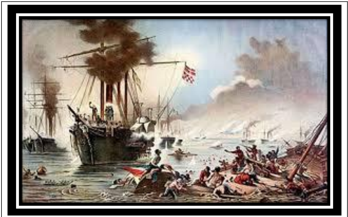
Figura 1 - A batalha de Riachuelo, a maior batalha naval da América do Sul, liderada pelo Almirante Barroso que neutralizou a capacidade ofensiva estratégica do Paraguai (Fonte: Museu Histórico Nacional).

Batalha do Riachuelo! A maior batalha naval da América do Sul. E o Almirante Barroso — à frente! Histórica mensagem do líder Hasteada na fragata Amazonas — ao ter início a ação. "O Brasil espera que cada um cumpra com o seu dever!"