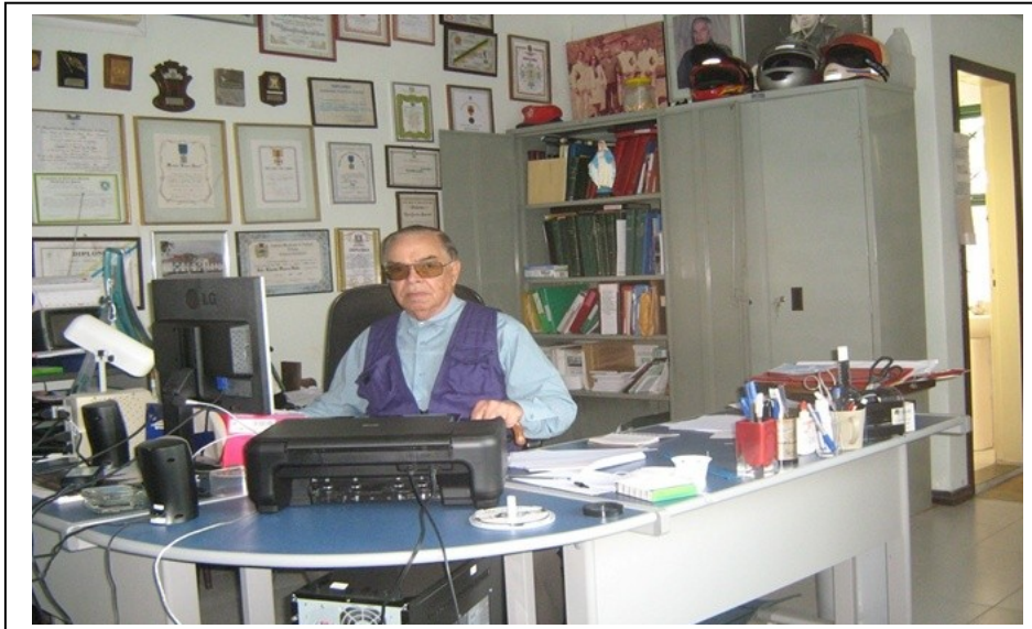
O AUTOR EM SEU ESCRITÓRIO NO BAIRRO JARDIM DAS ROSAS EM ITATIAIA-RJ ONDE RESIDE DESDE 1991

Participamos em 28 de abril de 2011, em Porto Alegre, junto com vários integrantes da Federação das Academias de História Militar Terrestre do Brasil (FAHIMTB), do Seminário do Livro Branco de Defesa Nacional, promovido pelo Ministério da Defesa.