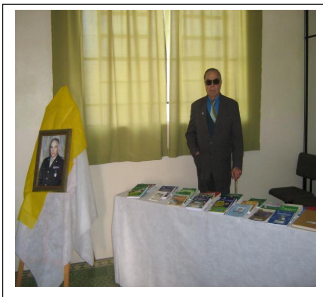
Fotos de meus livros conservados na Biblioteca do CFENSA. criada pela Irmã Firmina Simon.