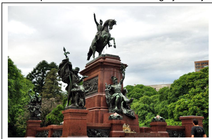
General José de San Martín, el Padre de la Patria Argentina y Libertador de Argentina, Chile y Perú, la veneración al héroe liberador en el Bicentenario de la Independencia de Argentina, el 9 de julio 2016, Federación de Academias de Historia Militar de Tierra de Brasil (FAHIMTB)