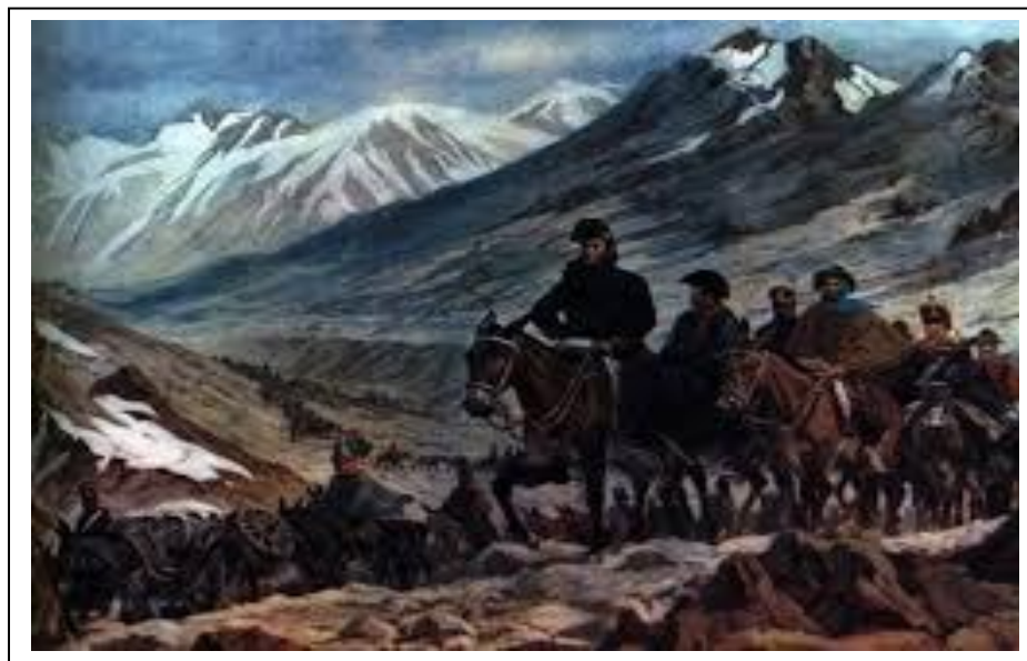
Alegoría del cruce de la cordillera por el Ejército de los Andes al mando del General José de San Martín, disponible en Internet.

Pero en el mando del ejército había un gran general, inspirado por un ideal de una América del Sur libre.