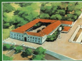
Fortaleza N. S. da Assunção em Fortaleza - CE, atual QG da 10ª RM onde o Patrono da Infantaria ingressou no Exército como voluntário, em 16 de julho de 1830, no 22º Batalhão de Caçadores ali aquartelado.