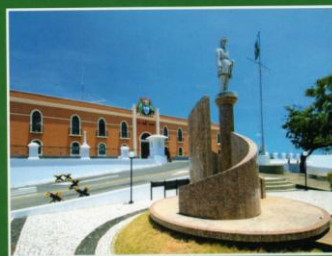
Panteon do Brigadeiro Antônio de Sampaio, com sua estátua e restos mortais defronte o QG da 10ª Região Militar.

ESTE TEXTO POSSUI FALHAS QUE O AUTOR PROCURA EXPLICAR NO TITULO INICIAL DE LIVROS E PLAQUETAS EM, POR FAVOR LEIA ANTES DE INICIAR SUA LEITURA OU PESQUISA. PORTANTO SÃO IDÉIAS OU SUGESTOES