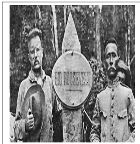
Nas fotos a esquerda, o General Rondon ao lado do ex-presidente dos EUA Cel Theodoro Roosevelt em sua histórica expedição, em Mato Grossos e Amazônia 1913/1914. À direita a foto do Marechal Rondon, próximo do fim de sua preciosa e exemplar vida.

Em razão desta intervenção dos jesuítas, não foi cumprido o Tratado de Madrid, foi eliminada expressiva parcela da população masculina de índios missionários que enfrentaram tropas de Portugal e Espanha em diversos encontros e, o índio Sepé Tiaraju foi morto em São Gabriel atual, pelo então Governador de Montevideu. Em decorrência Espanha e Portugal expulsaram os jesuítas de seus domínios na America do Sul. O culto a lendária memória de Sepé Tiaraju que enfrentou as soberanias de Espanha e Portugal na Guerra Guaranítica e que virou “História”. Soberania herdada pelo Brasil em sua Independência, mas afrontada pela lenda de Sepé Tiarajú e seu bordão. “Esta terra tem dono” , usada politicamente pelo MST e inclusive foi usados blindados do Exército Brasileiro nas Missões. Marechal Rondon que no Paraná fez frente a Coluna Miguel Costa Prestes, e generalizada como Coluna Prestes, esta pequena nascida em Santo Ângelo, com a Revolta de Prestes, do 1º Batalhão Ferroviário, a qual que se juntou a Grande Coluna Miguel Costa, originária de São Paulo e passou a ser chamada de Coluna Miguel Costa Prestes, fato reconhecido por Prestes em entrevista a uma TV em São Paulo, em presença do General Miguel Costa. História é verdade e Justiça!