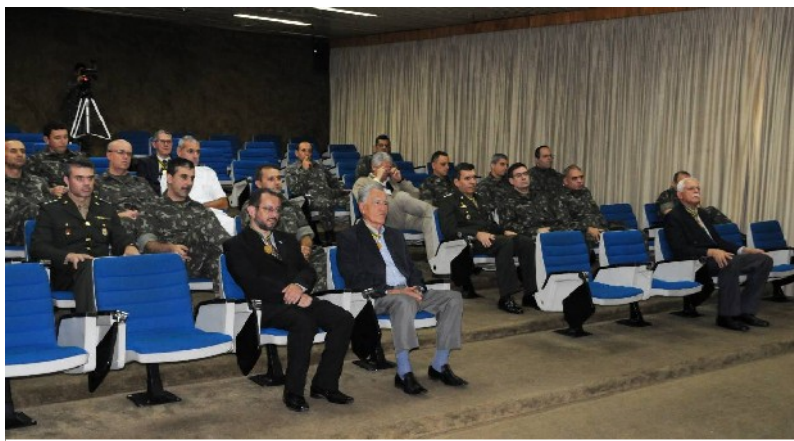
Civis e militares prestigiaram o evento na AMAN

Há 15 anos fundamos aqui em Resende a Academia de História Militar Terrestre do Brasil para colaborar com o Exército nesta tarefa relevante, relacionada como o sonho de Caxias, de nacionalização de nossa Doutrina Militar. E foram expressivas as suas realizações.