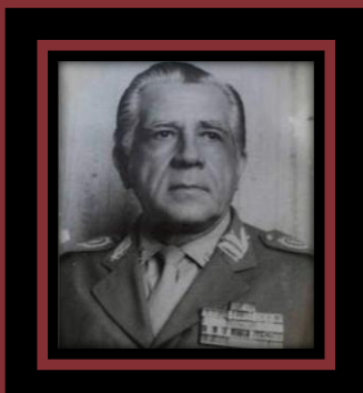
Gen. Plínio Pitaluga