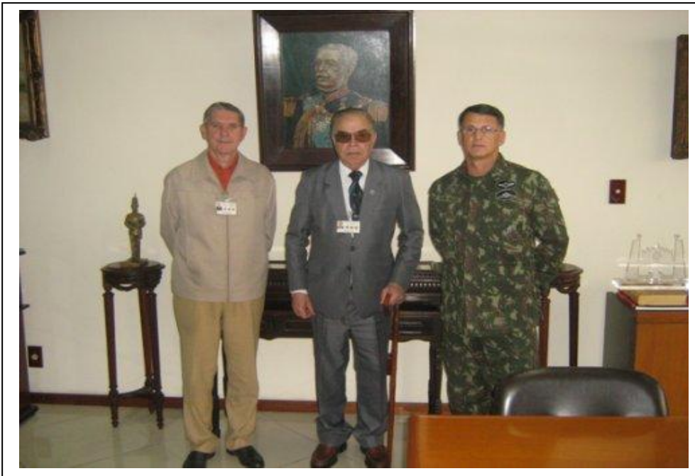
Foto no Gabinete do Comandante da AMAN, na tarde de 14 de julho de 2010, depois da histórica audiência sobre o futuro da Academia de História Militar Terrestre do Brasil, vendo-se, da esquerda para a direita,